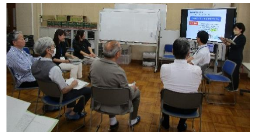
協議にて活発な意見交換がされました。